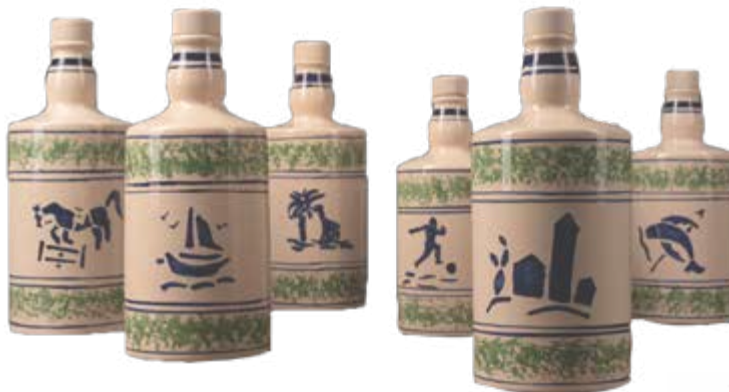
102441 (nur im Set erhältlich)