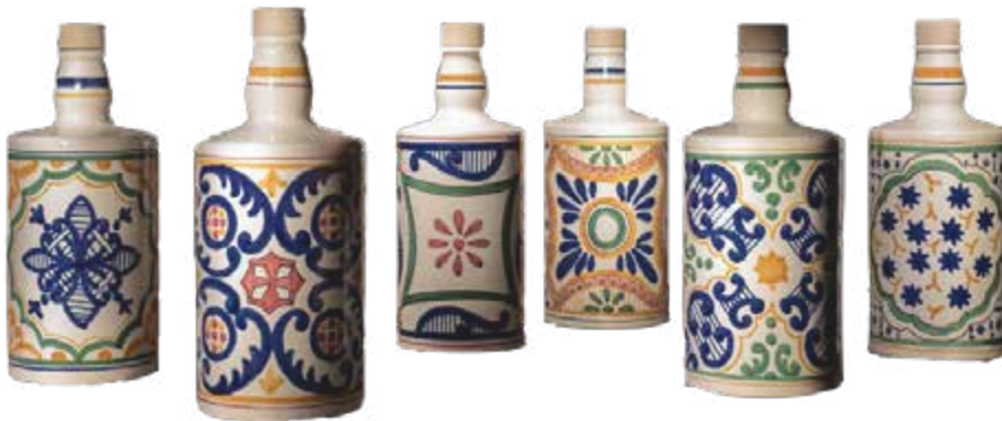
102440 (nur im Set erhältlich)